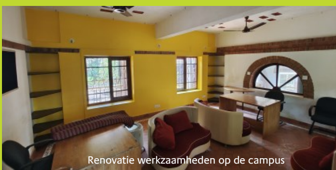
Renovatie werkzaamheden op de campus