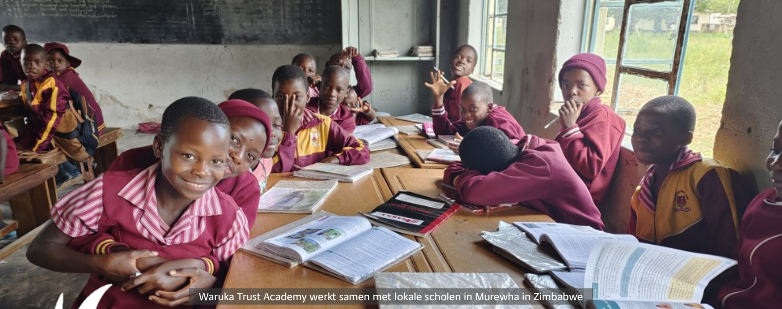
Waruka Trust Academy werkt samen met lokale scholen in Murewha in Zimbabwe