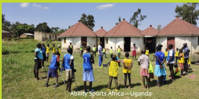
Ability Sports Africa—Uganda

Ondertussen had ons team de handen vol aan het klaarmaken van de